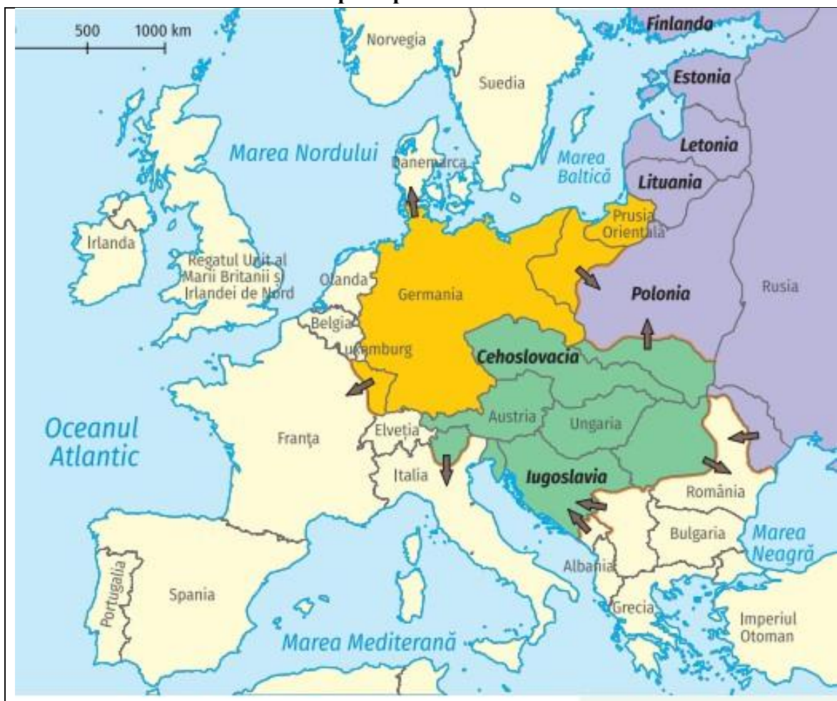
Sursa E. Europa după Primul Război Mondial

Subiectul III. Înțelegerea și reprezentarea timpului și a spațiului istoric. utilizarea adecvată a limbajului de specialitate. determinarea relațiilor de cauzalitate și schimbare în istorie (34 de puncte).