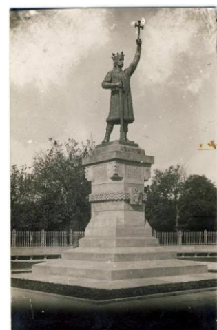
Фото: Памятник Штефану Великому и Святому, открытый в Кишиневе 29 апреля 1928 г.