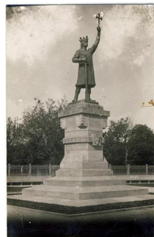
Foto: Monumentul lui Ștefan cel Mare și Sfînt, dezvelit la 29 aprilie 1928, Chișinău